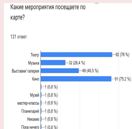
Результаты опроса журналиста

Среди посещаемых мероприятий лидирует театр и кино, второе место делят выставки и галереи, а третье занято музыкой. Реже посещают мастер-классы, планетарии и музеи.