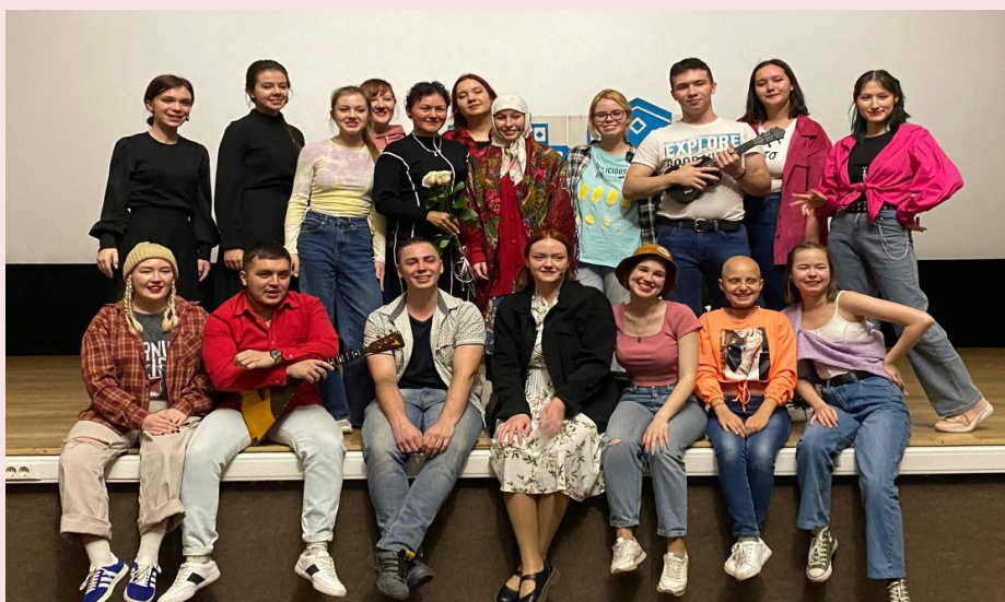
Студенческий театр «По ролям»

Театральное мастерство – одна из самых необычных форм творчества, которое помогает человеку понять свой внутренний мир, проявить себя и почувствовать другого человека. Сцена – место, где можно примерить на себя множество самых разнообразных образов, вжиться в роль и показать такие качества характера, о которых даже сам подумать не мог. Работа над голосом, сценическим образом, речью – все это лишь малая часть, в которую предстоит окунуться.